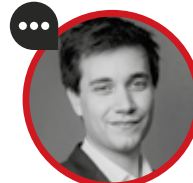
PIERRE PERSON Député LREM ASSEMBLEE NATIONALE